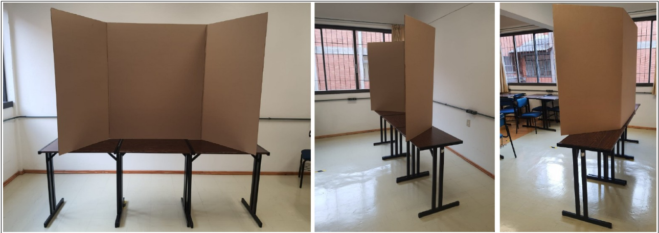
Figura 1: O estande para exibição do projeto consiste de três mesas escolares. O painel de papelão com informações do projeto deve ser apoiado sobre as mesas.

A estrutura dos estandes para exibição dos projetos na XV MOSTRASEG é composta por três mesas escolares. O painel de papelão com as informações do projeto ficará apoiado sobre as mesas escolares, conforme nas imagens da Figura 1. O painel deve ser providenciado pelos alunos.