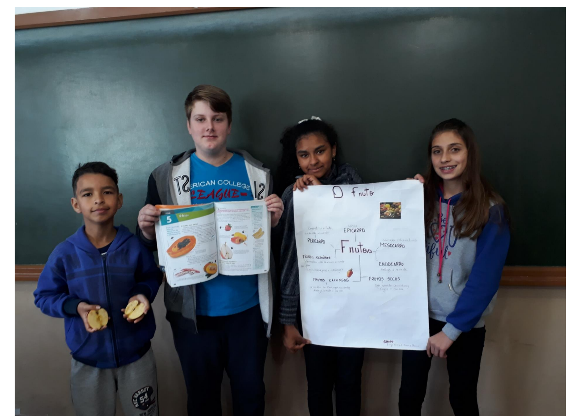
Figura 3: grupo compartilhando o conhecimento a respeito dos frutos.