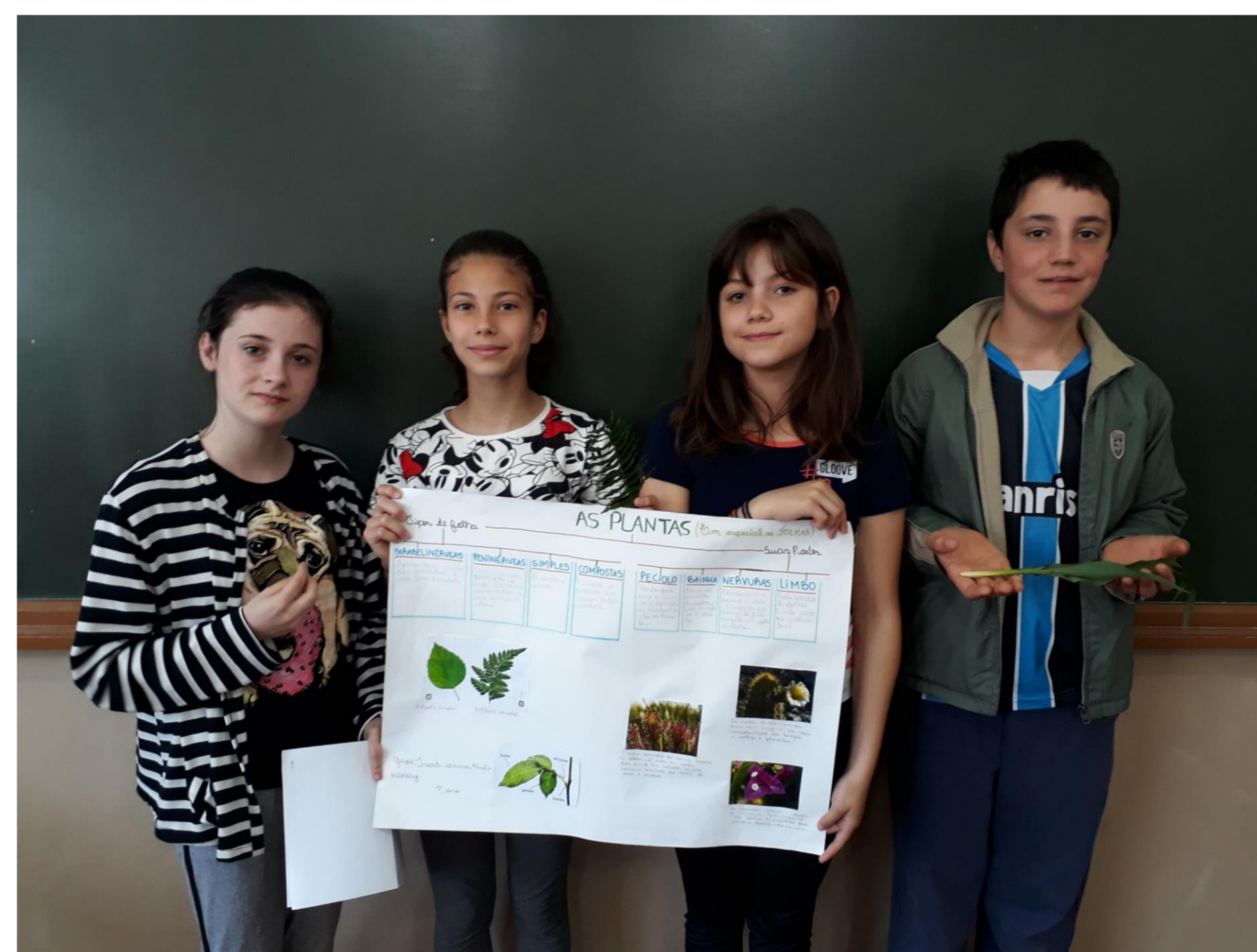
Figura 2: grupo compartilhando o conhecimento a respeito das folhas.